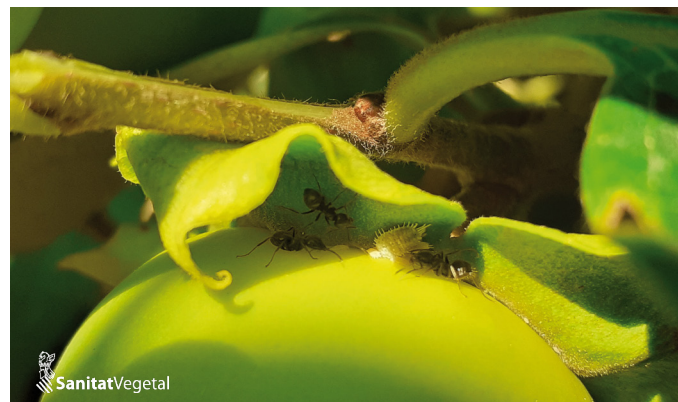
Formigues i cotonet

Productes autoritzats: oli de parafina, oli de taronja, sals potàssiques d'àcids grassos, spirotetramat, sulfoxaflor (autorització excepcional).