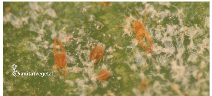
Colònia de l'àcar roig oriental en la fulla

El llindar de tractament s'aconsegueix quan el percentatge de fulles ocupades per l'àcar de Texas o l'àcar roig oriental siga major del 20% entre agost i octubre i del 80 % la resta de l'any.