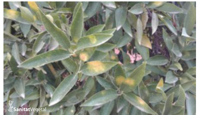
Fulles simptomàtiques per atac de l'aranya roja

En aquests moments i en algunes parcel·les es comença a veure noves colònies en les fulles joves.